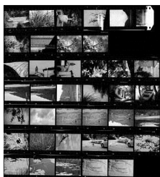
Prove sul campo

La lista dei negozi italiani in qualità di "Rollei Fim Point" è consultabile in rete, come pure tutti gli aggiornamenti tecnici.