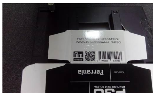
indicazione del batch